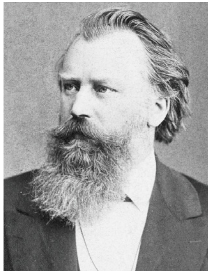
Johannes Brahms (1882)

So musste Brahms wohl oder übel etwas komponieren, um sich seines Dokortitels würdig zu erweisen. Das schien ihn zu ärgern. Denn die Akademische Festouvertüre , die er im Folgejahr ablieferte, unterläuft alle Erwartungen an ein weihelvolles, ernstes Stück. Stattdessen zitiert Brahms darin lauter Studentenlieder: Burschenschafts-Gesänge wie Wir hatten gebauet ein stattliches Haus (angestimmt von den Trompeten), Was kommt dort von der Höh' (Oboen), auch bekannt als Ein Schneider fing 'ne Maus , oder die Studentenhymne schlechthin, Gaudeamus igitur (Lasst uns also fröhlich sein), die das ganze Orchester im Finale abfeuert. Die Melodien verband Brahms raffiniert mit seiner eigenen musikalischen Handschrift – und führte der Breslauer Elite so noch einmal genüsslich vor, warum sie ihm den Dokortitel verliehen hatte.