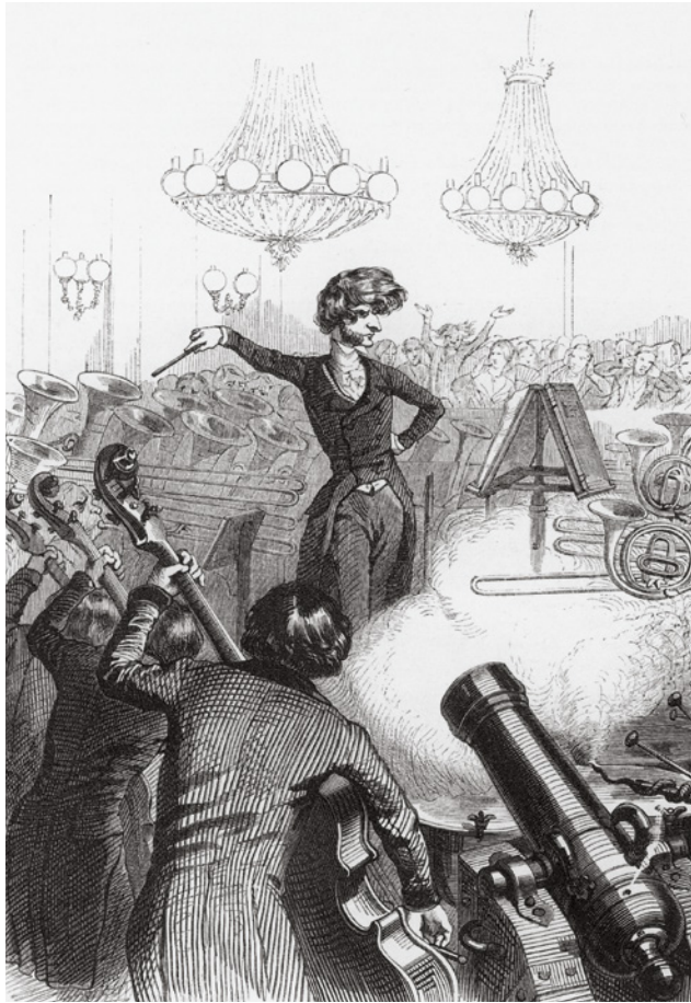
Berlioz dirigiert seine Symphonie fantastique . Zeitgenössische Karikatur

Im vierten Satz geht die Fantasie endgültig mit Berlioz und seinem musikalischen Alter Ego durch. Im Liebeskummer hat er sich in den Opiumrausch gestürzt und halluziniert nun, er habe seine Geliebte ermordet und werde hingerichtet. Begleitet von Marschrhythmen und Fanfaren schreitet er zum Richtplatz. Noch auf dem Schafott denkt er an die idée fixe , doch da