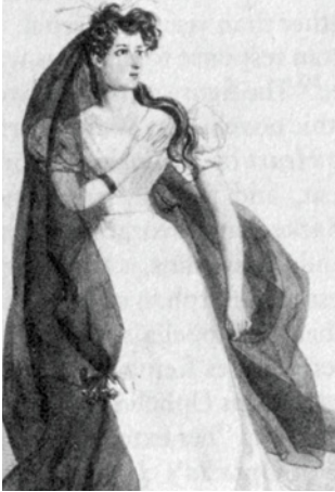
Harriet Smithson als Ophelia

»Man muss aufmerksam sein bei der Symphonie fantastique , denn immer wieder taucht sie auf: die idée fixe . So einfach und doch so genial, ein roter Faden durch ein Werk, das zum Ende hin immer düsterer wird und in einer meiner liebsten Melodien endet, der Dies Irae -Sequenz aus der katholischen Totenmesse. Wenn sie erstmalig in den Fagotten und der Tuba erklingt, läuft mir regelmäßig ein kalter Schauer über den Rücken.«