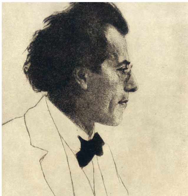
Gustav Mahler, Kaltnadelradierung von Emil Orlik, 1902

„Die Fünfte ist ein verfluchtes Werk. Niemand capiert sie.“ So klagte Gustav Mahler über die Rezeption seiner 1904 uraufgeführten 5. Sinfonie. Anders als in den vorangegangenen Sinfonien Mahlers nehmen weder programmatische Hinweise noch Singstimmen das Publikum an die Hand, um die monumental orchestrierte, mitunter zersplittert wirkende Komposition zu verstehen: nach einem Trauermarsch ein „stürmisch bewegter“ zweiter Satz, dessen Schlusschoral im Sand zu verlaufen scheint; im Zentrum des Werks ein grotesk ausuferndes Scherzo; schließlich ein Finalsatz, der mit einem Sammelsurium an Motiven in eine wilde Apotheose taumelt. Im Gegensatz zur schwierigen Anfangsbeziehung zwi-