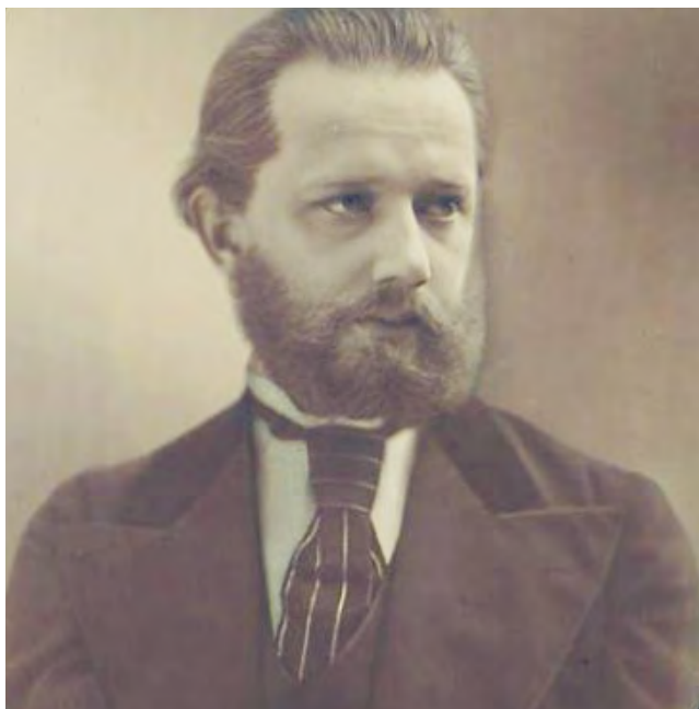
Pyotr Tschaikowsky um 1870

die Überleitungen zwischen den Variationen erscheinen in stets unterschiedlicher Gestalt. Nach einem tänzerischen Andante grazioso übernimmt in der fünften Variation die Flöte das Thema, bevor das Violoncello den Satz mit einer ausgedehnten, virtuoson Solokadenz beschließt. Eine Romanze in d-Moll mit Pizzicato-Begleitung als vorletzter Satz kontrastiert mit dem wirbelnden Allegro vivo des Finales.