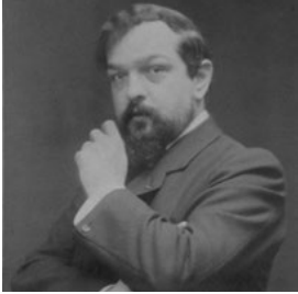
Claude Debussy (1908)