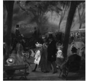
William Glackens: „The Drive, Central Park“ (um 1905)