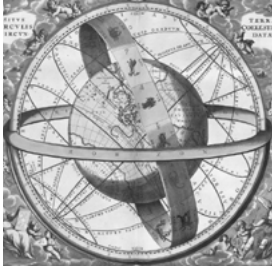
Andreas Cellarius: „ Harmonia Macrocosmica “, Tafel 11: Die Lage der von den Himmelskreisen umgebenden Erde (1660)