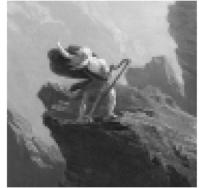
John Martin: „The Bard“ (1817)

Obwohl wir nun nicht genau wissen, was Wahres daran ist, so wissen wir doch sicher, dass kundige Männer aus alter Zeit diese Überlieferung für wahr gehalten haben.