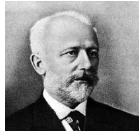
Peter Tschaikowsky (1893)