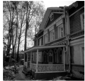
Das Tschaiakowsky-Haus in Klin, der letzte Wohnsitz des Komponisten, wo er u. a. auch an der „Pathétique“ arbeitete

Entsprechend ist der 2. Satz ein warmherziger Walzer, der doch kein echter Walzer ist: Statt im 3/4-Takt steht er im unregelmäßigen 5/4-Takt. Erstaunlich, dass die