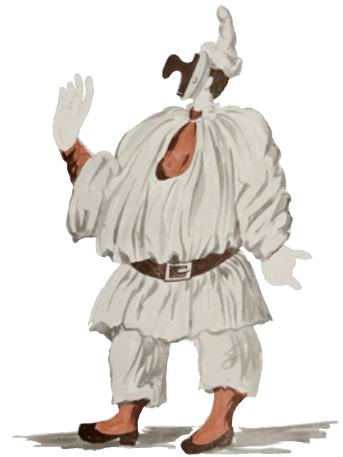
Pulcinella-Kostümentwürfe von Maurice Sand (1860, oben) und Pablo Picasso (1919)