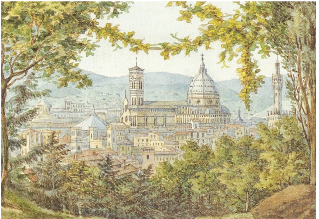
Die Kathedrale Santa Maria del Fiore im Aquarell »Blick auf Florenz« von Felix Mendelssohn Bartholdy

Auffallend sind die Vitalität und spielerische Ausgelassenheit der beiden Ecksätze. Insbesondere das spritzige Hauptthema des ersten Satzes, mit dem die Sinfonie beginnt, ist von seinem signalhaften und nach vorn trei-