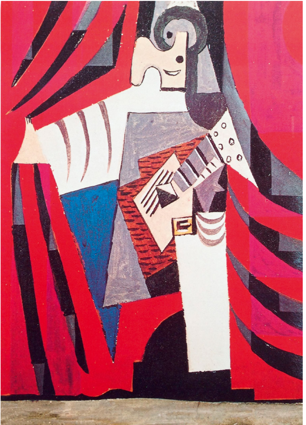
Pablo Picasso: Pulcinella mit Gitarre