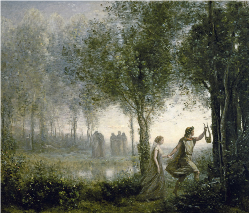
Orpheus geleitet Eurydike aus der Unterwelt, 1861 gemalt von Jean-Baptiste Camille Corot

Er glaubt, hinter sich die Furien zu hören und wendet sich um. Daraufhin verliert er Eurydike erneut. Der Chor der Geister besingt das Lob der Selbstbeherrschung als hohe Tugend.