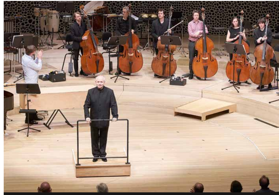
George Benjamin mit dem Ensemble Modern Orchestra in der Elbphilharmonie (10.3.2019)

Kommen sich Komponist und Dirigent manchmal in die Quere?