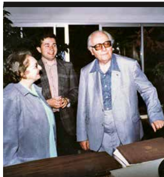
George Benjamin (Mitte) mit Olivier Messiaen und dessen Frau Yvonne Loriod

Ich schätze die Momente, wenn ich meinen Schreibtisch verlasse, um mit anderen Musik zu machen – auch wenn diese Momente zunehmend rar werden. Natürlich hilft das meiner eigenen Musik. Aber über die Jahre habe ich ein ziemlich breites Repertoire dirigiert, sogar mit gelegentlichen Ausflügen ins 18. und 19. Jahrhundert.