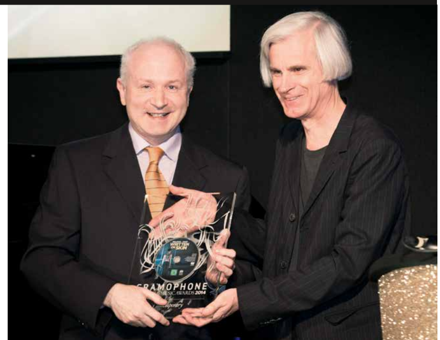
George Benjamin und Martin Crimp bei der Verleihung des Gramophone Contemporary Award 2014

Ihr Lehrer Olivier Messiaen hat Ihr Talent als Komponist einmal mit dem von Mozart verglichen. Ist das nicht eine große Bürde?