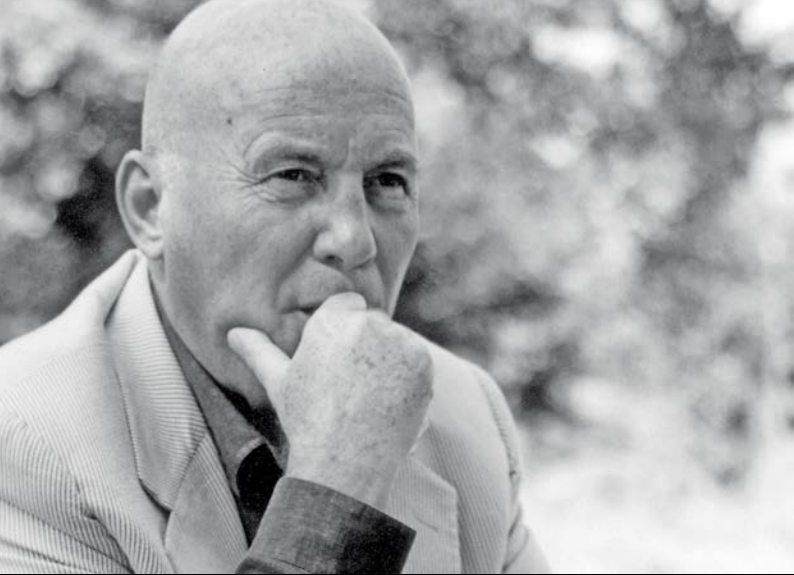
Hans Werner Henze