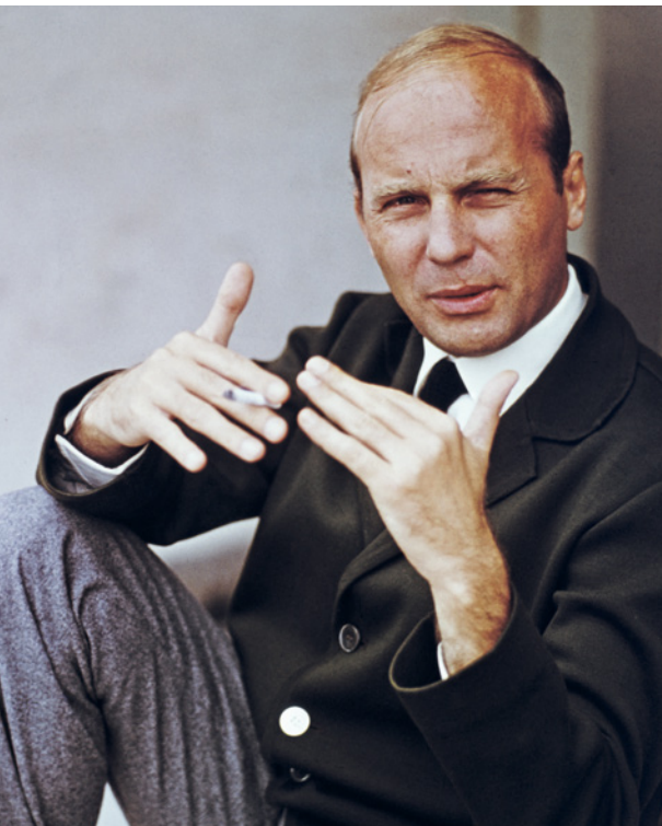
Hans Werner Henze

ein Laien-Schauspiel junger künstlerisch ambitionierter Ortsansässiger komponiert. Aus diesen und ähnlichen Materialien habe ich nun diese kleine volksliedförmige Kammermusik zusammengesetzt mit dem Bedürfnis, etwas von der Atmosphäre, von der Stimmung dieses melancholischen Landes festzuhalten wie einen Traum oder wie eine schmerzliche Erinnerung.«