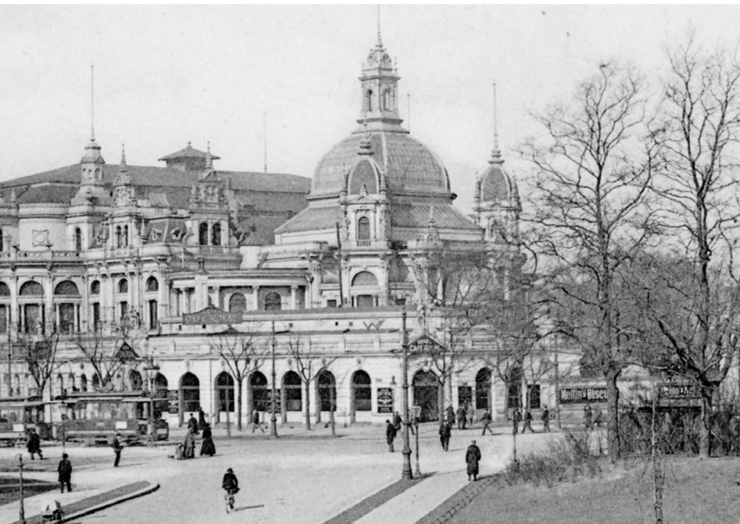
Das Konzerthaus Ludwig am Millerntor um 1900, fotografiert von der Helgoländer Allee aus; links geht es auf die Reeperbahn

ob er nun eine Handlung vertont hatte oder nicht – oder ob er das Budapest-Format am Ende nur gewählt hatte, um Vergleichen mit Beethovens Sinfonien aus dem Weg zu gehen. Für die Hamburger Aufführung suchte er jedenfalls »krampfhaft nach einem großartigen und kühnen Titel«, wie es ein Musikkritiker überlieferte. Am Ende wurde es Titan , bezugnehmend auf den gleichnamigen Roman von Jean Paul, dessen wirre Handlung sich irgendwie auf die Sinfonie beziehen ließ. Mahler schrieb sogar erläuternde Kommentare für den Programmzettel.