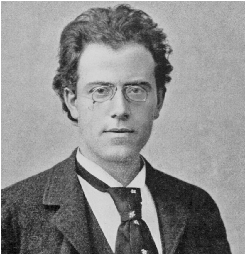
Gustav Mahler, 1892

Und ihr erster Satz beginnt mit – nichts. Aufgefächert über fünf Oktaven halten die Streicher den Ton a; wie die seidige Oberfläche eines unendlich tiefen Sees. »Wie ein Naturlaut« überschrieb Mahler diesen Beginn. Einzelne Motiv-Elemente tauchen auf und durchbrechen die Fläche: eine Linie der Holzbläser, der Kuckucksruf einer Klarinette, Fanfarenstöße der Trompeten, ein Hornchoral, eine bedrohliche Basslinie. Mit dieser collageartigen Einleitung gewährt Mahler Einblick in das kompositorische Arsenal, mit dem er die folgende Musik zu bestreiten gedenkt. Erst nach etlichen Minuten schält sich aus dem Kuckucks-Intervall ein erstes echtes Thema der Celli heraus. Es handelt sich um das Lied Ging heut morgen übers Feld aus dem Zyklus Lieder eines fahrenden Gesellen . Eigene und fremde Musik zu zitieren ist typisch für Mahler. »Das Komponieren ist wie ein Spielen mit Bausteinen«, schrieb er einmal seiner Freundin Natalie Bauer-Lechner, »wobei aus denselben Steinen immer ein neues Gebäude entsteht.«