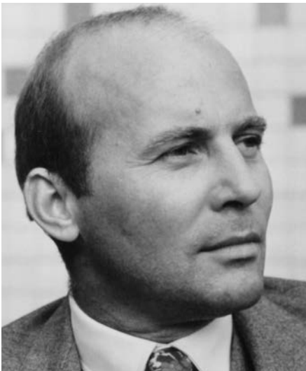
Hans Werner Henze

Die Widmung an Benjamin Britten ist ein weiterer Zugang zum Quartett, das Henze am 2. Januar 1977 beendete, wenige Wochen nach dem Tod seines Freundes an Herzversagen. Die auffällige Rolle des »Herzschlages« in dieser Musik lässt sich wohl am plausibelsten mit diesem Bezug erklären. Der zweite, »atemlos, wilde« Satz endet in einem reinen Gewaltausbruch: Die Musik steigert sich bis zum fünffachen Forte, statt Noten schreibt Henze nun nur noch gezackte Linien und fordert für die letzten