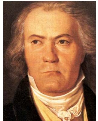
Ludwig van Beethoven, 1823

Der Anlass für diese Spielerei ist banal. Der reiche Musikliebhaber Ignaz Dembscher hatte die Uraufführung des vorigen Streichquartetts durch das Ensemble von Beethovens Freund Ignaz Schuppanzigh mit der Begründung geschwänzt, er könne Beethoven ja die Stimmen abkaufen und das Werk in seinem eigenen Haus von einem besseren Quartett aufführen lassen. Beethoven ließ ihm daraufhin ausrichten, dass er ihm die Stimmen erst verkaufe, wenn er den geschmähten Geiger großzügig entschädige – und auf Dembschers verdutzte Nachfrage »Muss es sein?« reagierte er mit dem kleinen Scherzkanon Es muss sein, ja, ja! Heraus mit dem Beutel!