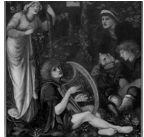
Edward Burne-Jones: „Der Wahnsinn des Tristan“ (1862)

Es ist einer der großen Gänsehautmomente der Konzentrliteratur. Im Epilog seines „Tristan“ schichtet Hans Werner Henze drei klangliche Ebenen übereinander, von denen jede dazu angetan ist, uns im Innersten zu treffen. Eine unschuldige Kinderstimme berichtet vom tragischen Ende einer fatalen Liebe: Ein Knabe liest Verse, die Isolde's Tod beschreiben, aus dem Epos „Tristan“ (1160) von Thomas de Bretagne. Dem unterliegt der körperlichste und intimste Klang,