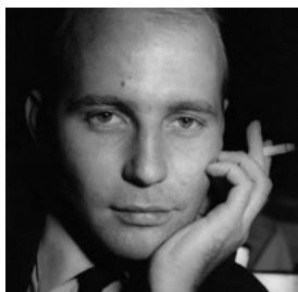
Hans Werner Henze im Jahr 1965

Der „Tristan“, den ich allerdings nie gesehen, wenn auch genau studiert habe, ist inzwischen eine Art Evangelium für mich geworden.