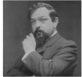
Claude Debussy (1908)

Das frappanteste Beispiel für Debussys „visionäre Begabung“ (Manuel de Falla) ist „Ibéria“, das zweite