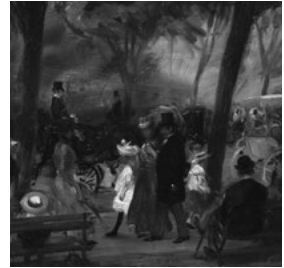
William Glackens: „The Drive, Central Park“ (um 1905)

New York war damals die am schnellsten wachsende Metropole der Welt, und der Versicherungsmann und Künstler Ives hatte sein Ohr dicht an ihrem rasant schlagenden Herzen. Ein realistisches Bild des Lebens in einer modernen Großstadt zu zeichnen, war etwa das Ziel der Künstlervereinigung „Ashcan School“. Die „malenden Reporter“ bildeten, vom Sonntagsspaziergang bis zum Hochhausbrand, den Alltag in dem urbanen Schmelztiegel der Kulturen und Klassen ab. Ives' hyperrealistische Toncollage „Central Park in the Dark“ verfolgt ein ähnliches Anliegen. 1906 schuf der Komponist zwei Orchesterstücke, die er unter dem Titel „Contemplations“ zusammenfasste: Die eine dieser musikalisch-metaphysischen Betrachtungen war das heute so bekannte „The Unanswered Question“, die andere das Hörprotokoll eines nächtlichen Parkbesuchs.