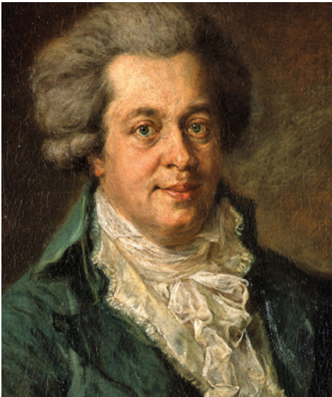
Wolfgang Amadeus Mozart um 1790

»Ich würde mich gerne in zwei Richtungen gleichzeitig entwickeln: als Japaner, was die Tradition, und als Westler, was die Neuerung betrifft. Tief in mir möchte ich beide musikalischen Strömungen bewahren.« Tōru Takemitsu , der wohl bekannteste und originellste japanische Komponist